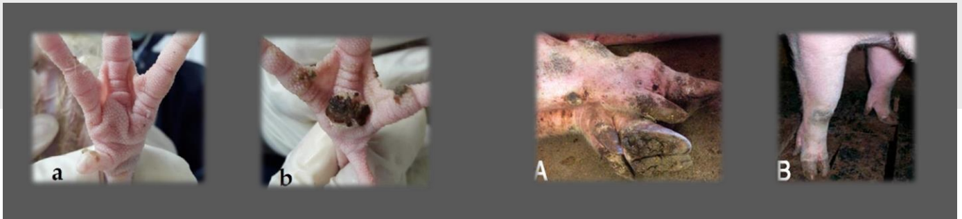
Figura 1: imágenes de lesiones podales (a y b avicultura, A y B porcino).

El material orgánico presente en la cama contiene nitrógeno (N) proveniente del ácido úrico y proteínas no digeridas, que será transformado por los microorganismos de la cama generando compuestos nocivos, como el amoníaco ( \text{NH}_3 ). El N amoniacal permanece en los primeros 80 cm del suelo, en forma de ion amonio en la cama o como \text{NH}_3 volátil en el ambiente. Una concentración elevada de amoníaco contribuye a la aparición de dermatitis en las almohadillas plantares (a-b) y quemaduras en la piel (A-B) y mamas (Figura 1), así como lesiones respiratorias y oculares, derivando en un aumento de decomisos de las canales. El aumento del pH y de la humedad de la cama son factores que aumentan la producción de amoníaco volátil agravando esta situación.